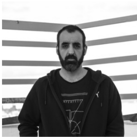
[ https://www.diphuelva.es/cultura/contenidos/PABLO-CASPE/ ]