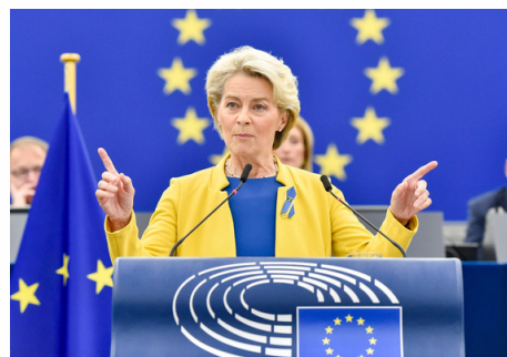
DISCURSO SOBRE EL ESTADO DE LA UNIÓN DE 2022 PRONUNCIADO POR LA PRESIDENTA VON DER LEYEN