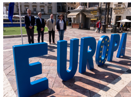
DIPUTACIÓN E INSTITUCIONES ONUBENSES SE DIERON CITA EN LA CÉNTRICA PLAZA DE LAS MONJAS PARA CELEBRAR EL DÍA DE EUROPA.