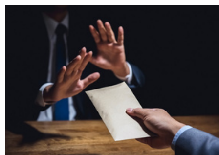
Lucha contra la corrupción