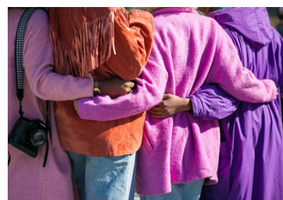
UNIÓN EUROPEA POR EL DÍA INTERNACIONAL DE LA MUJER