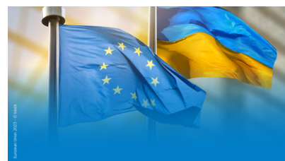
ERASMUS+ EN APOYO AL SECTOR DE LA EDUCACIÓN UCRANIANO