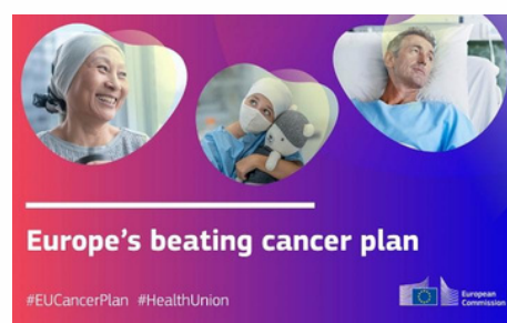
PLAN EUROPEO DE LUCHA CONTRA EL CÁNCER.