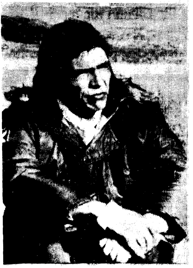
Dennis Banks, dirigente del movimiento indio

B. DEL CASTILLO (Fiel, Servicios, Especiales de EFE).