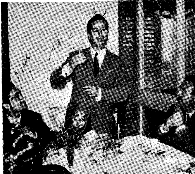
Un caballo de plata para el tablero de honor junto al que se reúnen a diario portugueses y españoles, con esa plena dedicación que les define. El jefe de la expedición lusitana lo entregó al presidente de la Española.

Le fue ofrecido un almuerzo en el Santa María