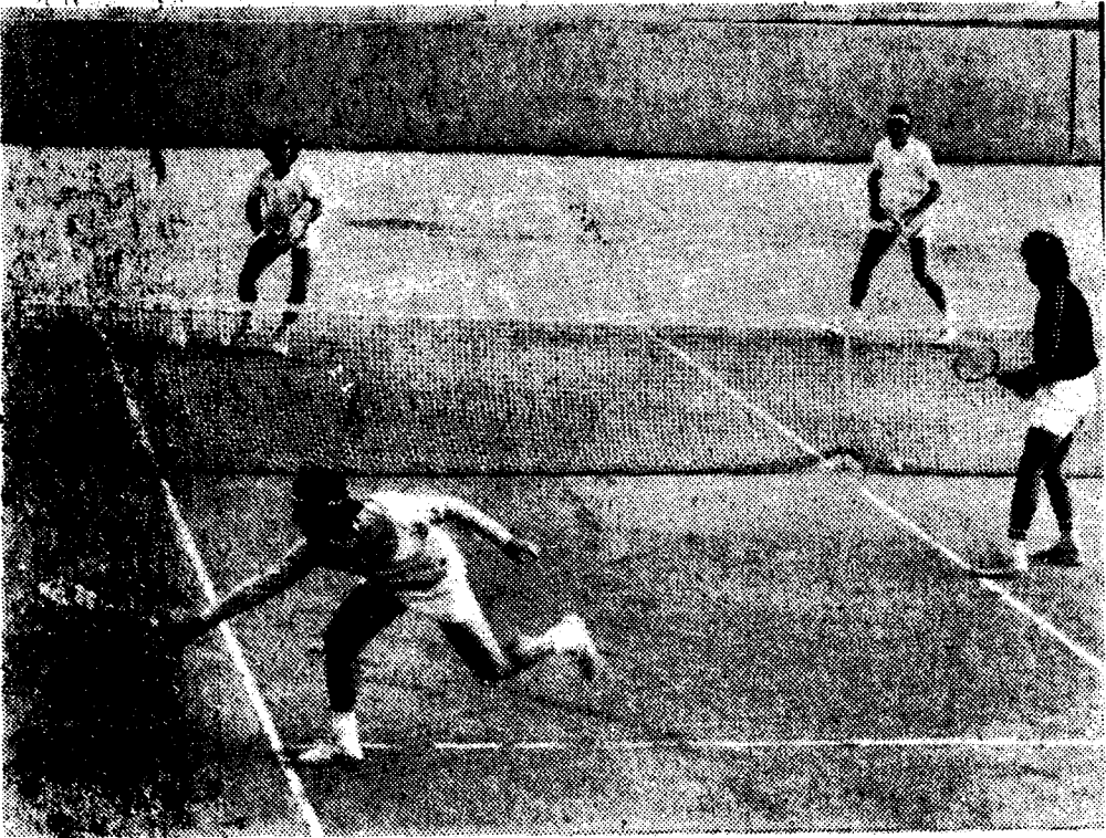
Uno de los encuentros de dobles celebrado ayer.

Continuaron ayer disputándose los encuentros correspondientes al trofeo de tenis «Copa del Rey» que se juega en las pistas del Real Club Recreativo de Tenis.